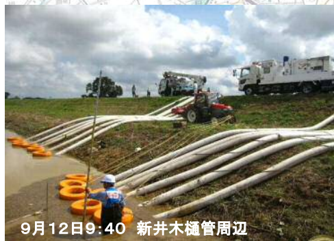
9月12日9:40 新井木樋管周辺